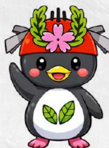
しびらっきー (ゆるキャラVer.)