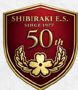
50周年記念エンブレム